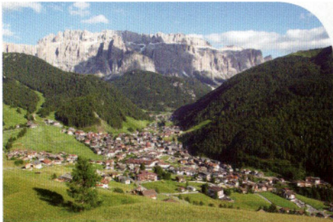
Sëlva Gherdëina Selva Gardena Wolkenstein

Ortisei 1236 m, S. Cristina 1428 m e Selva Gardena 1563 m si distendono tra i 1200 e i 1700 m di altitudine. Prati e piste da sci superano i 2500 m e la vetta più alta raggiunge i 3181 m.