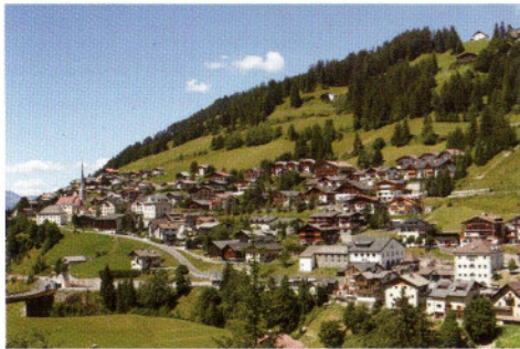
S. Cristina St. Christina