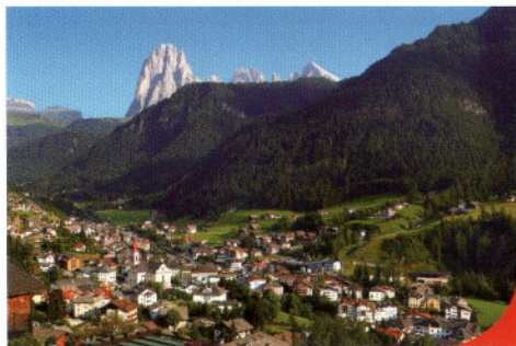
Urtijëi Ortisei St. Ulrich