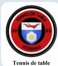
Tennis de table