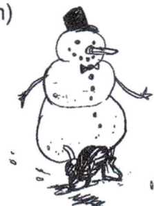
Marche de Nouvel An Neujahrsmarsch