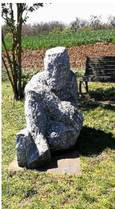
17. Ruhende Kraft