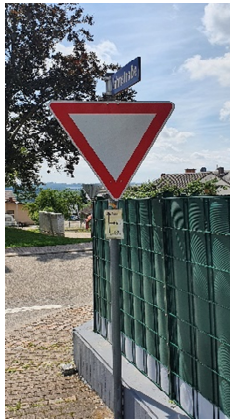
6. Trennung 2