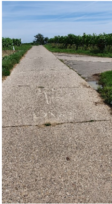
5. Trennung 1