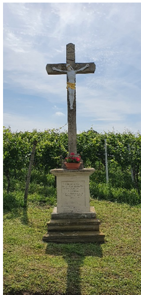
2. Aneresels Kreuz

Wir gehen die Pfalzstraße gerade weiter hoch bis zur Hauptstraße, hier gehen wir nach rechts, der Hauptstraße folgend erreichen wir wieder das Bäckerei-Cafe Senger, Start und Ziel 2.