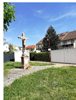
1a. Fußweg Im Horenzacker

Wir gehen den Kapellenpfad hoch und den geraden Weg weiter bis zum Aneresels Kreuz (2.) . Hier gehen wir nach rechts die Steigung hoch, bis zum nächsten asphaltierten Weg, zweimal nach links gehend erreichen wir die Letzenbergkapelle (3.) . Wir bleiben auf diesem Weg und erreichen die Hauptstraße am Ortseingang Malschenberg, Hauptstraße überqueren und nach rechts gehen, nach ca. 100m erreichen wir ein Wegkreuz (4.) , hier links abbiegen. Nach ca. 200m kommen wir zur Streckentrennung (5.) .